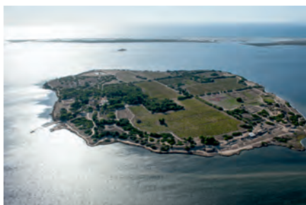
Isola di Mothia