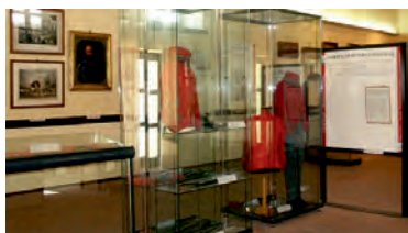
Museo Garibaldino Complesso Monumentale San Pietro