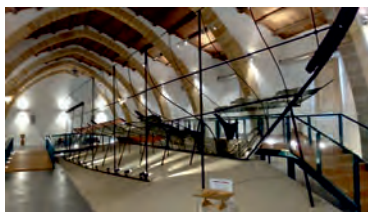
Nave Punica" Museo Baglio Anselmi