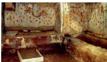
Crispia Salvia - Sito Archeologico