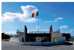
Monumento ai Mille