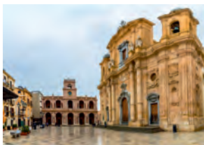
Chiesa Madre Palazzo VII Aprile